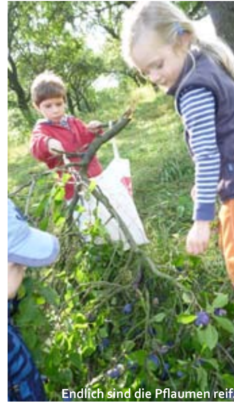
Endlich sind die Pflaumen reif.