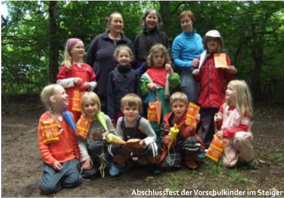
Abschlussfest der Vorschulkinder im Steiger